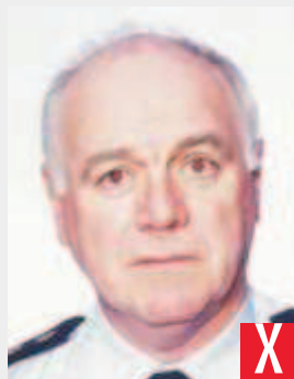
effetto occhi rossi