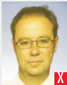
tonalità innaturale della pelle