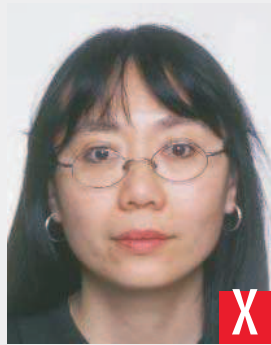
montatura che copre gli occhi