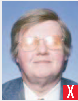
riflesso del flash sulle lenti