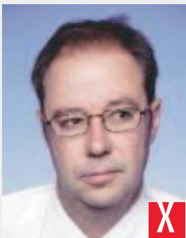
sguardo rivolto di lato