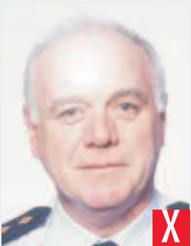
riflesso del flash sulla pelle