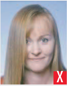
capelli sugli occhi