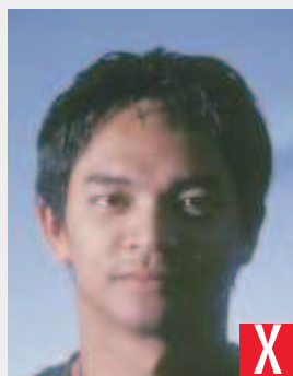
ombre sul viso