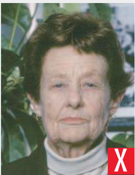
sfondo non a tinta unita