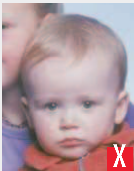
presenza di altra persona