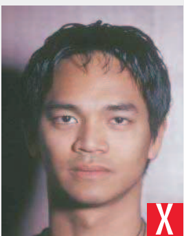
ombra dietro la testa