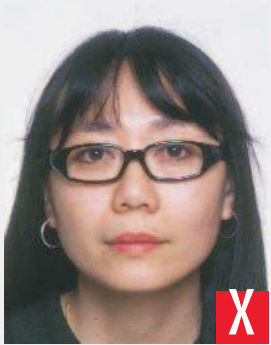
montatura troppo pesante